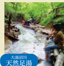
大湯沼川 天然足湯

温泉天国・北海道。その代表が地獄谷の観光でも知られている登別温泉です。9種類もの温泉が湧き出す日本有数の温泉郷として、質・人気ともに非常に高く、観光専門誌の調査で「日本一」に輝いたこともあります。